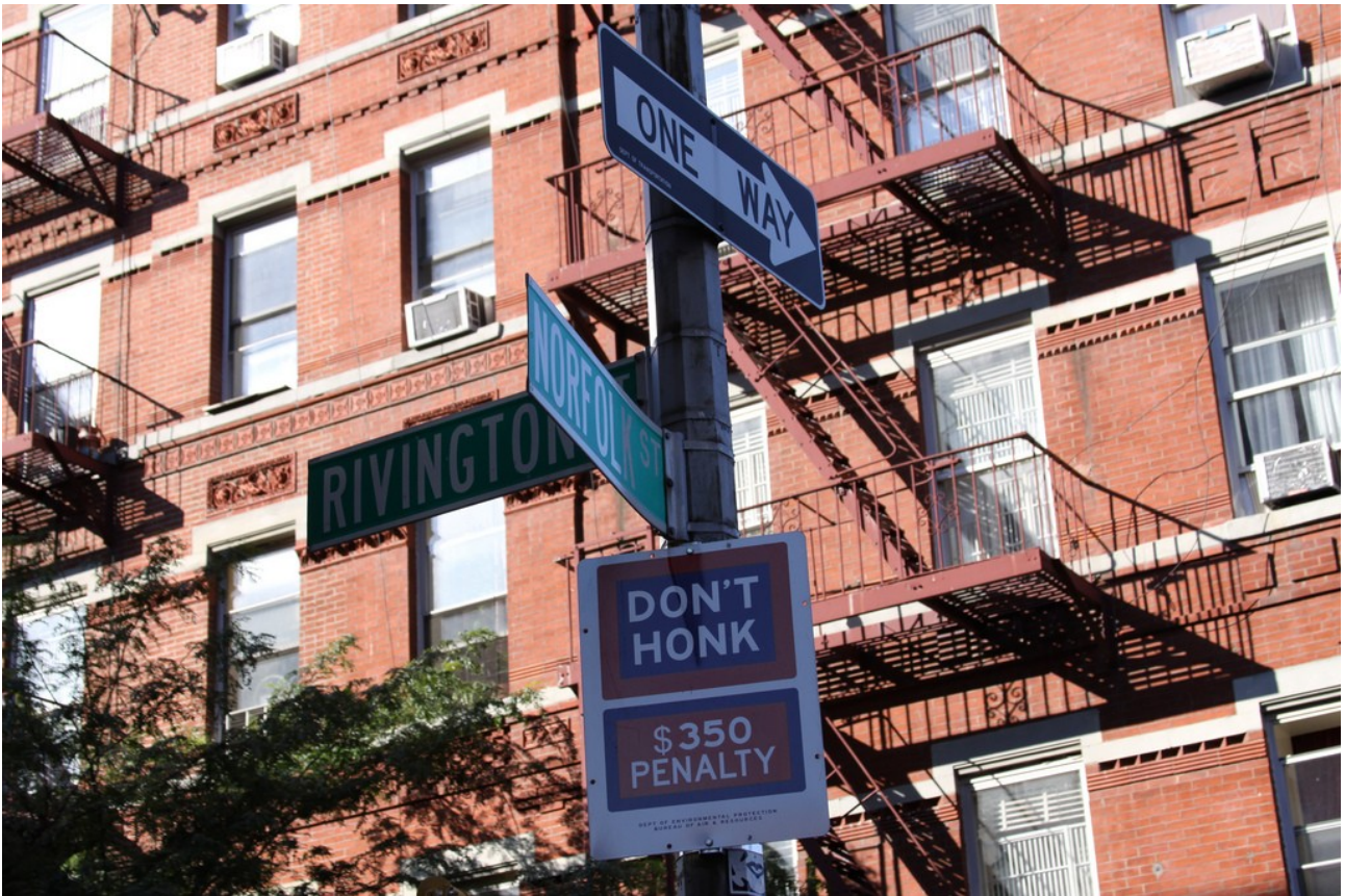
Lower East Side