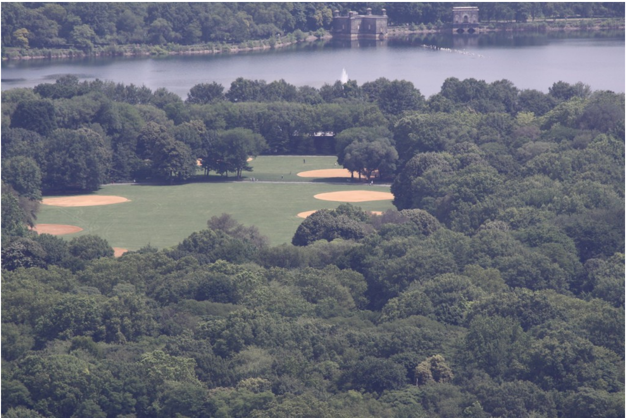
Vista de Central Park